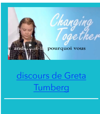
discours de Greta Tumberg