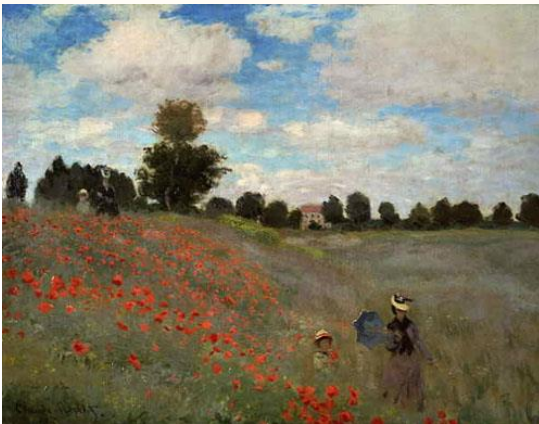
Les coquelicots, Claude Monnet - 1873