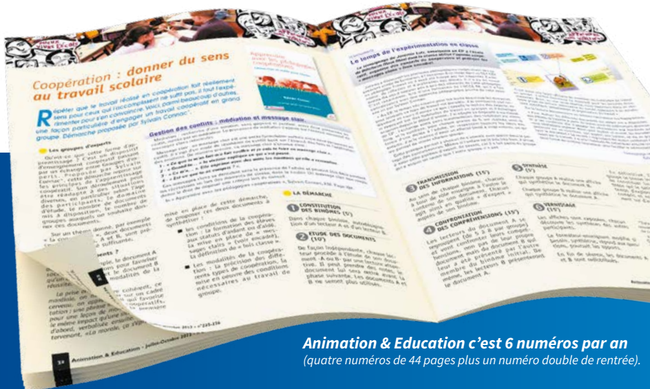
Animation & Education c'est 6 numéros par an (quatre numéros de 44 pages plus un numéro double de rentrée).