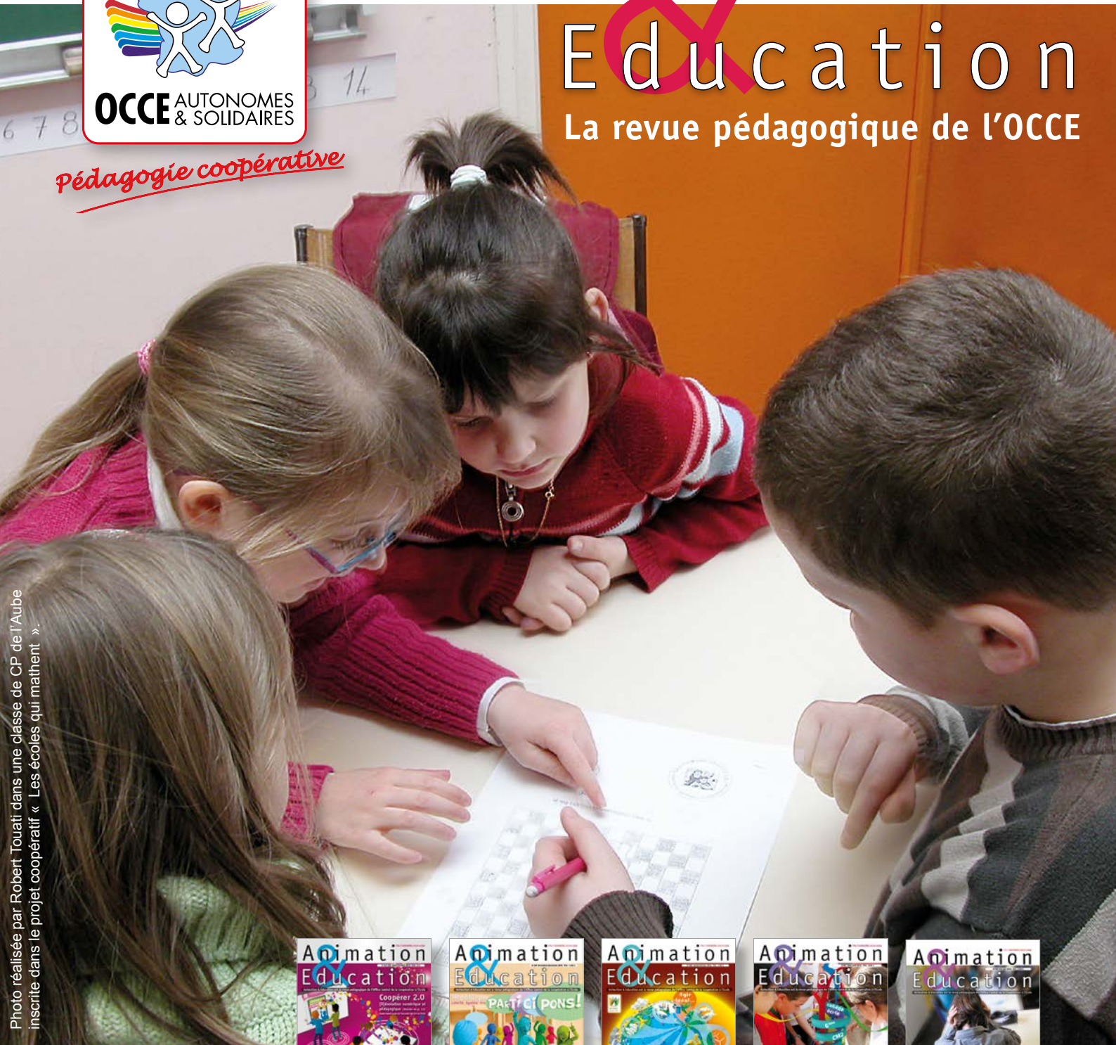
dans une classe de CP de l'Aube inscrite dans le projet coopératif « Les écoles qui mathent ».